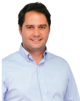
Ignacio Vázquez Casavilla Alcalde

Arranca 2022 y con él llegan nuevos propósitos y proyectos. Desde el Ayuntamiento hemos preparado una oferta de cursos y talleres para que cumplas algunos de ellos, como puede ser ponerte en forma, tener más conocimientos de tus aficiones o mejorar tu currículum realizando alguna actividad formativa. Y sin perder de vista la actual situación de pandemia que todavía persiste, ofreciendo plazas suficientes para atender la demanda y, a la vez, cumplir las medidas higiénico-sanitarias y de distanciamiento social para que los usuarios realicen sus actividades favoritas con la mayor seguridad posible.